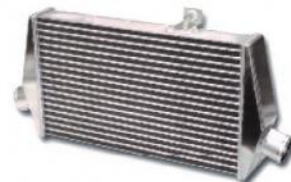
Codice Descrizione FMINTEVO Mitsubishi Evo 4 / 5 / 6