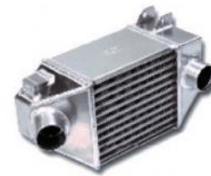
Codice Descrizione FMINT098 Ford Escort RS Turbo S2 Twin core