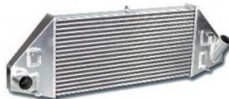
Codice Descrizione FMINTFSiT Ford Focus ST FSiT Front mount intercooler