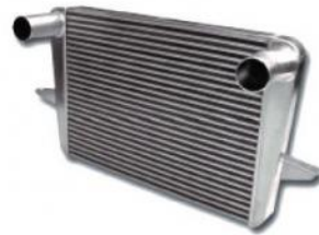
Codice Descrizione FMINT097 Ford Cosworth - RS 500 style 2 / 4WD - Escord Cosworth