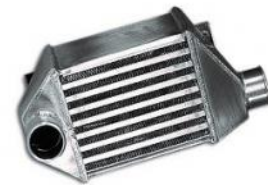
Codice Descrizione FMINT094 Fiat Uno Turbo 1.3