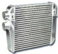
Codice Descrizione FMINTS3 Audi S3 Kit per montaggio frontale