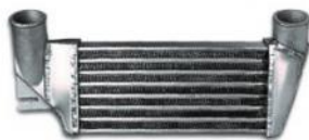
Codice Descrizione FMINT099 Ford Escort S1 uprated (exchange)