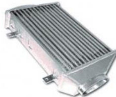
Codice Descrizione FMMININT Bmw Mini upgraded air to air intercooler kit