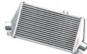
Codice Descrizione FMINTEVO8 Mitsubishi Evo 8