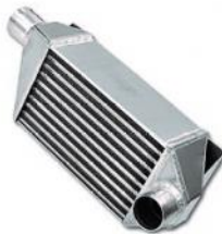
Codice Descrizione FMINT095 Fiat Uno Turbo 1,4