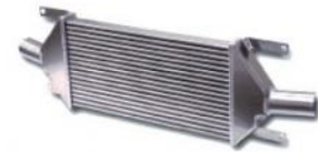
Codice Descrizione FMINTT225 Audi TT 225 Kit per montaggio frontale